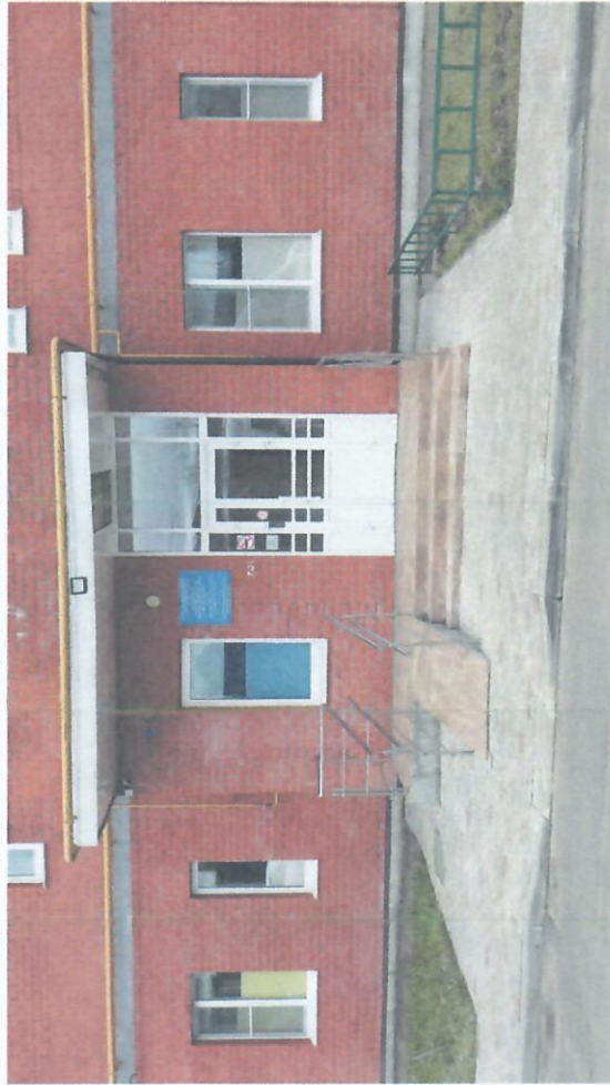
Подход к МБДОУ №103 "Лесная сказка" НСП "Лунтик" корпус 3 (центральная часть)