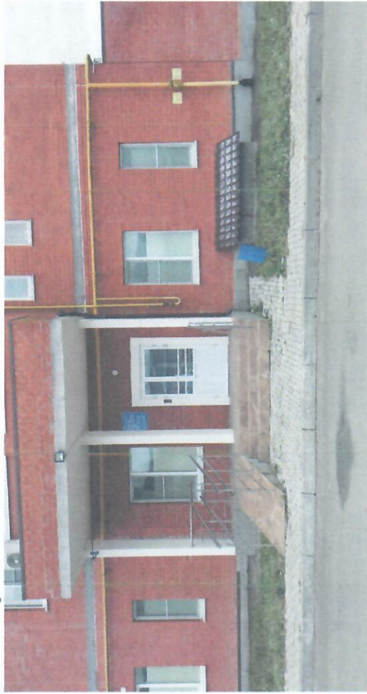
Подход к МБДОУ №103 "Лесная сказка" НСП "Лунтик" корпус 1 (центральная часть)