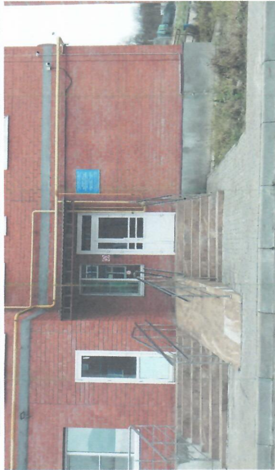
Подход к МБДОУ №103 "Лесная сказка" НСП "Лунтик" корпус 2 (центральная часть)